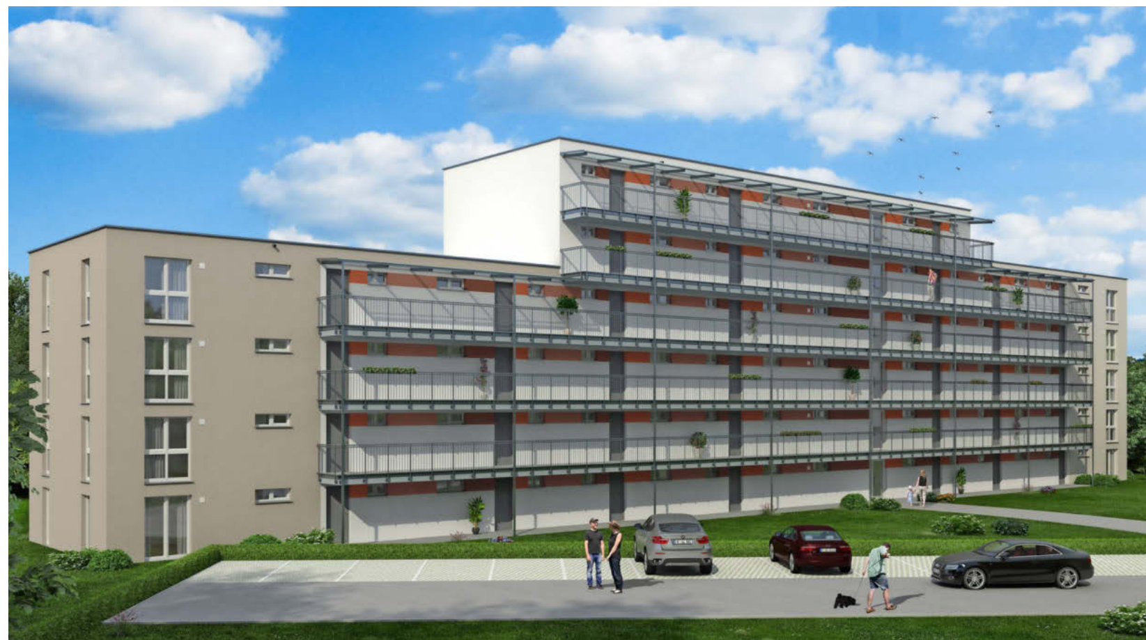
Modulare Bauweise senkt die Kosten erheblich. Die Gewo kann in diesem Gebäude beim Plattenwald-Krankenhaus eine Miete von 6,50 Euro garantieren. Visualisierung: Gewo

rung sieht die Gewo einen wichtigen Schritt. Allerdings lasse sich der aktuelle Mangel an kostengünstigem Wohnraum nur durch Baukostenzuschüsse lösen, betont der Geschäftsführer. So lange die Baukosten so hoch bleiben, ließe sich die angespannte Lage nicht entschärfen. Neubauten bei renditeorientierten Bauträgern kommen nicht unter zehn Euro Miete pro Quadratmeter auf den Markt – für viele Menschen aus unteren Einkommensschichten oder Leistungsempfänger nicht bezahlbar.