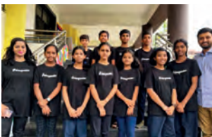
CSME Kawarsadi, Indien

Die Schulen werden sich auf dem 2. SDG-Jugendgipfel präsentieren und ihre Ideen vorstellen. Der Austausch und die Zusammenarbeit zwischen den verschiedenen Schulen und Kulturen sind von unschätzbarem Wert und tragen dazu bei, eine nachhaltigere Welt zu schaffen.