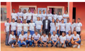
Queens Model School, Nigeria