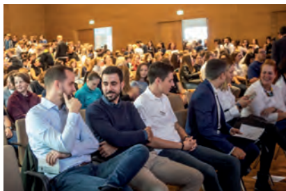
Bilder vom 1. SDG Jugendgipfel 2019 in Heilbronn, Bildungscampus