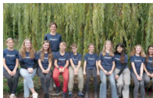
Entental Gymnasium, Bietigheim