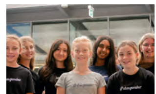
FvAG, Bad Friedrichshall